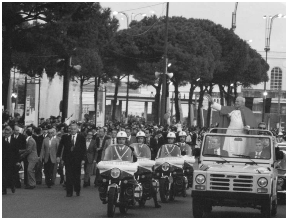
La storica prima visita del Papa a Napoli il 21 ottobre 1979

Anche il Cardinale Crescenzo Sepe, Arcivescovo di Napoli, ha fatto visita alla mostra, due volte nel gennaio del 2007 e nel febbraio del 2008.