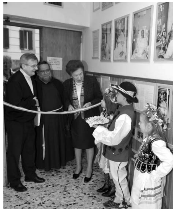
La mostra: il Sindaco taglia il nastro