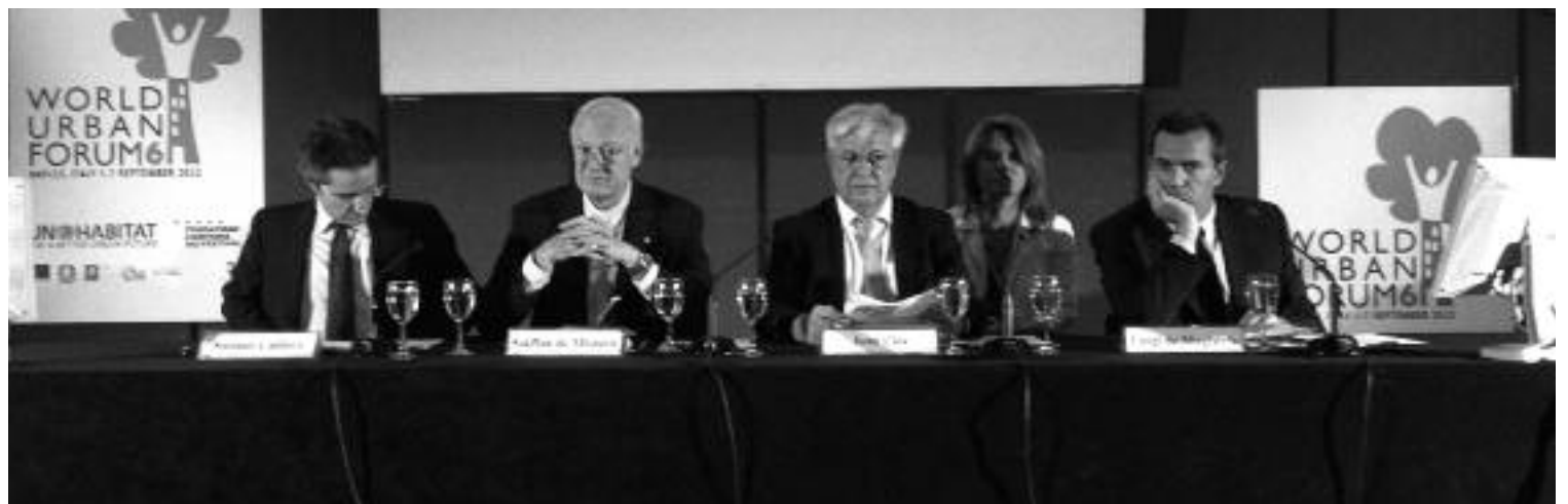
Presentazione del World Urban Forum a Castel dell'Ovo

Tra venti anni la percentuale delle aree mondiali urbanizzate passerà dal 50% attuale al 70%. Il modo in cui gestire questa rapida urbanizzazione si rivelerà il vero fattore chiave per la nostra sopravvivenza e prosperità. Sarà questo il tema che aprirà la sezione 'dialoghi' del sesto World Urban Forum ospitato da Napoli nella prima settimana di settembre che prevede la partecipazione di oltre 4000 delegati da circa 160 paesi del mondo, organizzato da Un Habitat, con Governo italiano, Regione Campania attraverso Fondazione Campania dei Festival, Comune di Napoli in collaborazione con Provincia di Napoli.