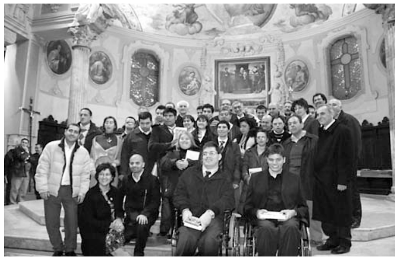
La celebrazione dello scorso anno

L'esperienza dei catechisti che hanno preparato i disabili ai sacramenti della Confermazione e dell'Eucarestia è proprio quella di veder trasformare la vita di queste persone dall'annuncio del Vangelo. Accompagnandoli nella catechesi all'incontro con "l'Amico Gesù", sempre più si scopre la loro forza di autentici testimoni che comunicano con la gioia l'amicizia di Dio verso i piccoli.