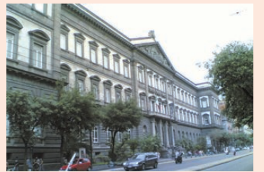
Giubileo per Napoli, l'incontro con il mondo accademico e con la scuola 8 e 9