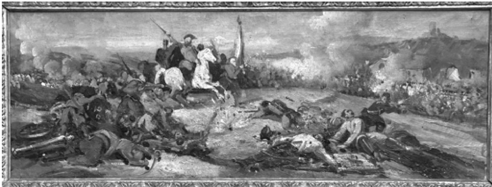
Michele Cammarano - Garibaldi al Volturno - Museo di Capodimonte

Nell'ambito della "XIII settimana della cultura - 9/17 aprile 2011", e si terrà al Museo Diocesano un concerto di musica classica domenica 10 aprile alle ore 11, in collaborazione con il FAI (Fondo Ambiente Italiano). Al termine del concerto gli ospiti potranno visitare il museo accompagnati dalle nostre storiche dell'arte. Il biglietto di 12 euro a persona, che potrà acquistarsi al museo, consentirà l'ascolto del concerto e successivamente la possibilità di visitare l'intero percorso museale. Il maestro Massimo Lo Iacono presenterà il Quartetto d'archi e oboe.