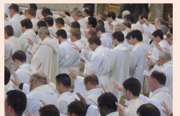
La formazione permanente dei presbiteri nella Chiesa di Napoli I, II, III e IV