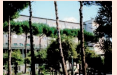
L'Assemblea plenaria del Clero 5