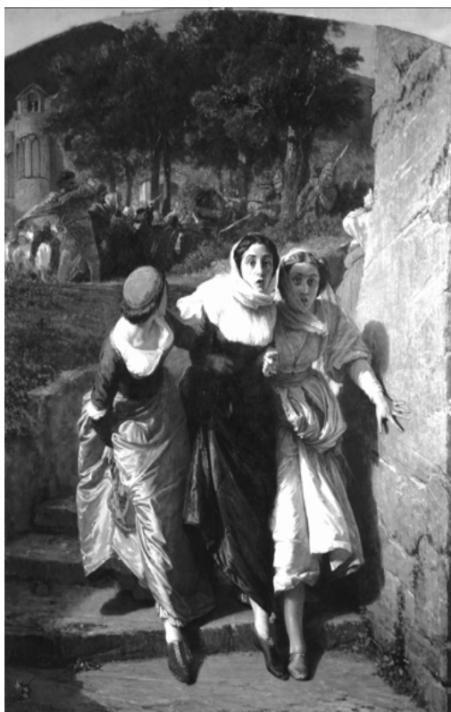
Domenico Morelli Vespri Siciliani - Museo di Capodimonte

Numerosi dipinti oggi esposti nella Galleria dell'Ottocento erano stati già presentati alla I Esposizione d'Arte dell'Italia Unita, che si era svolta a Firenze nel settembre del 1861. In quell'occasione, per la prima volta, venivano riunite opere provenienti da diverse regioni, espressione quindi delle diverse scuole artistiche regionali, con l'intento di individuare un linguaggio artistico unitario, che desse alla patria politicamente unita una unione anche nel campo dell'arte. A Firenze si esponevano anche molte opere di artisti che erano stati in prima persona coinvolti nelle lotte per l'unità, e che con le loro opere avevano contribuito a diffondere gli ideali patriottici. Fu lo stesso re Vittorio Emanuele II a commissionare alcuni dei dipinti più belli oggi nella Galleria di Capodimonte, con una commissione speciale per l'Unità d'Italia. Tra le tele in questione possiamo citare Dopo il diluvio di Filippo Palizzi, Mario vincitore dei Cimbri di Saverio Altamura, e Un episodio dei Vespri siciliani di Domenico Morelli, che troneggia al centro della Galleria, di fronte all'entrata, accogliendo il visitatore con il suo forte impatto visivo ed emotivo.