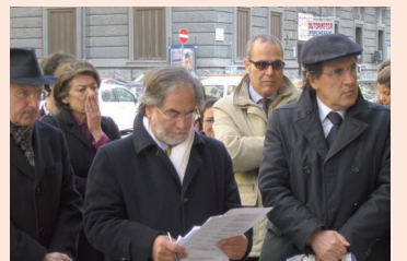
Giornata della memoria per le vittime innocenti della criminalità 11