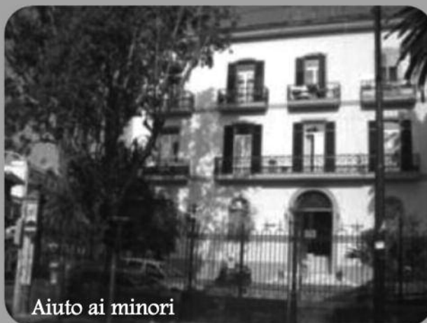
Aiuto ai minori