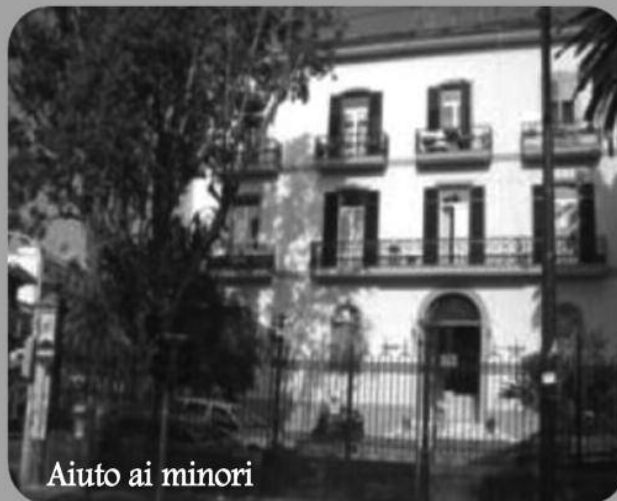
Aiuto ai minori