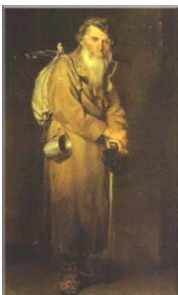
Vasily Perov, Pellegrino (1870). Galleria Tretjakov, Mosca.